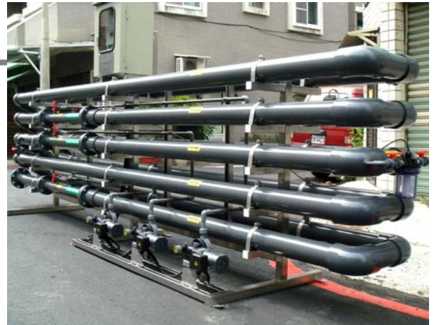
套裝型盤管式化學混凝膠凝設備 含化學幫浦,pH 控制與操控盤