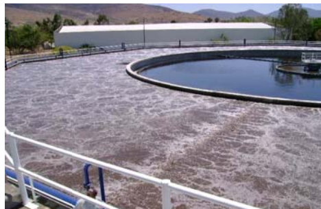
工業區污水廠 Ecoflex-520CV(20")曝氣盤