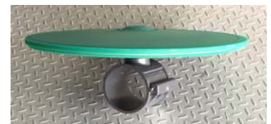
騎馬鞍座:配合 4",Sch.管徑