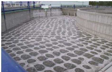
市政污水廠 Ecoflex-520CV(20")曝氣盤