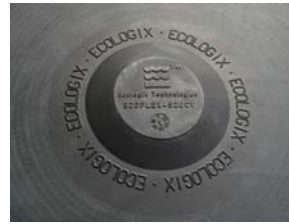
Perforation membrane, Made in U.S.A.